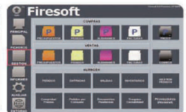
Compras, mayor y almacén