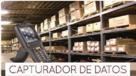
CAPTURADOR DE DATOS