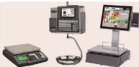
CONEXIÓN CON BALANZAS