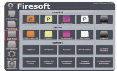
Compras, mayor y almacén